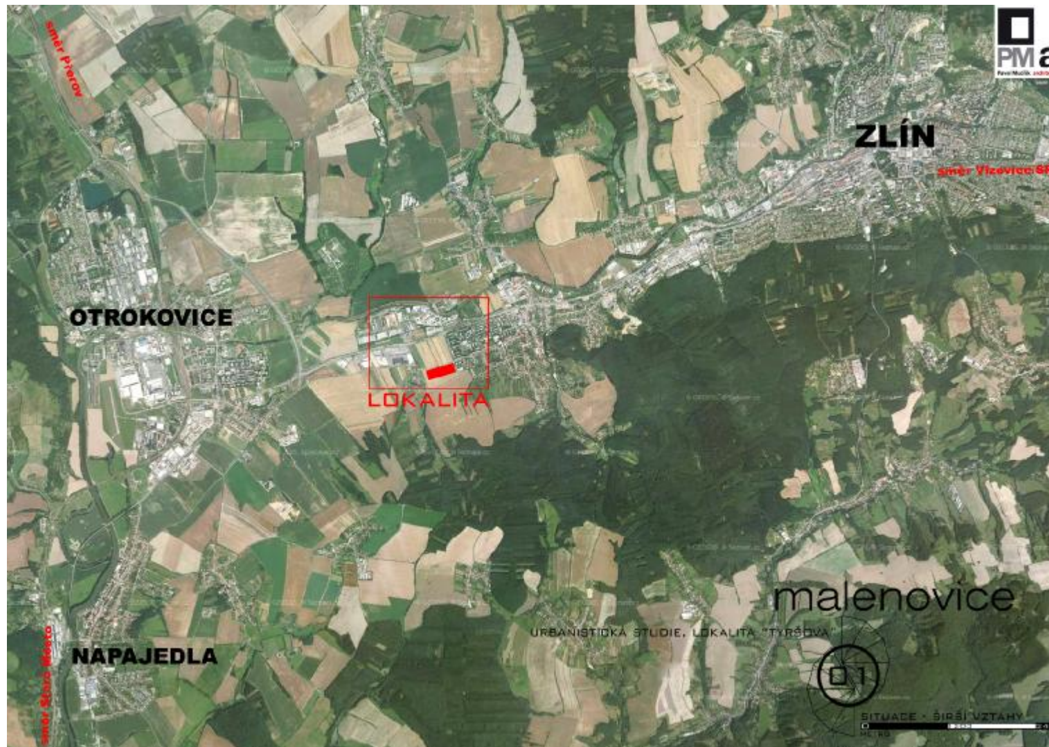
07 ŠIRŠÍ VZTAHY sv (4961x3508x16M jpeg)